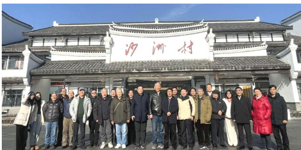
在沙洲村参观“半条被子的温暖”专题陈列馆